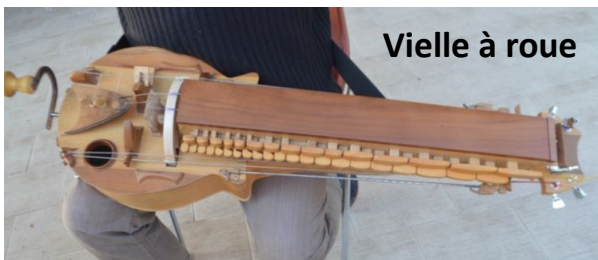
Vielle à roue

En ce 7 octobre 2021, nous découvrons la vielle à roue.