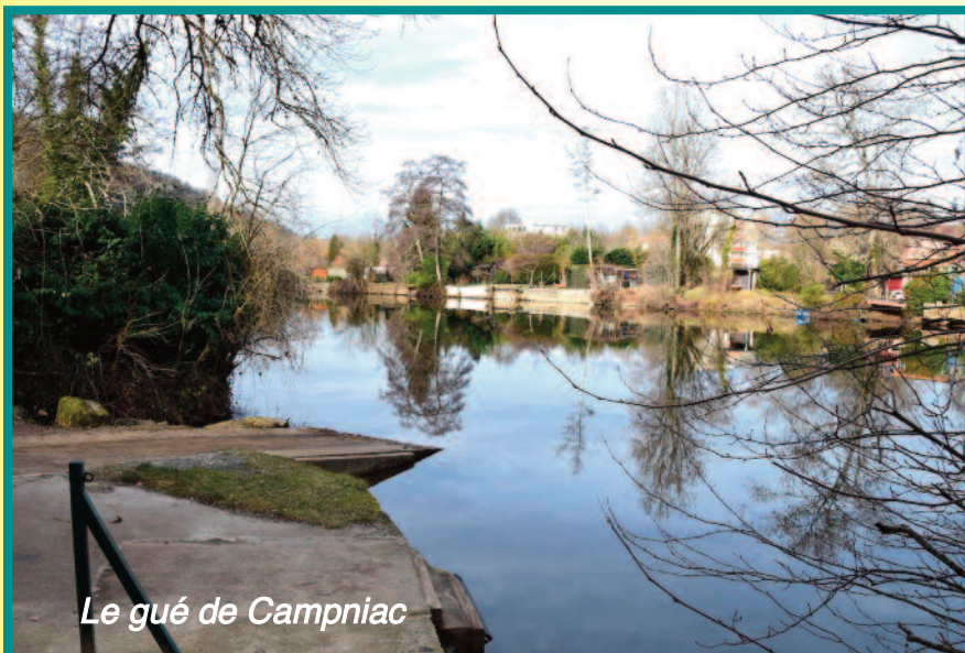
Le gué de Campniac

• LE GUÉ DE CAMPNIAC , carrefour routier gaulois et antique très important, le vallon de Vieille-Cité et la Maladrerie.