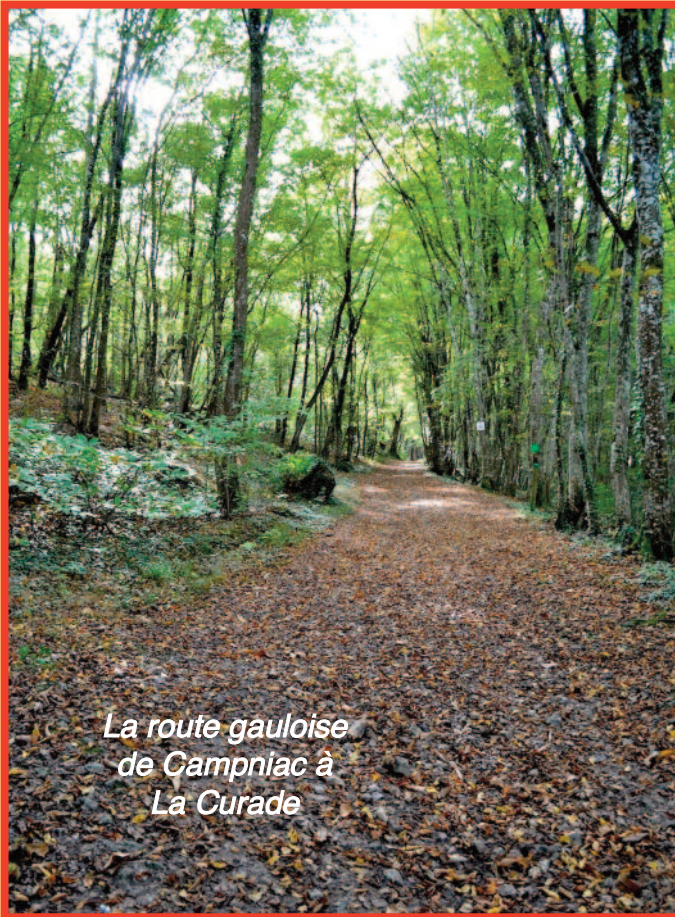
La route gauloise de Campniac à La Curade