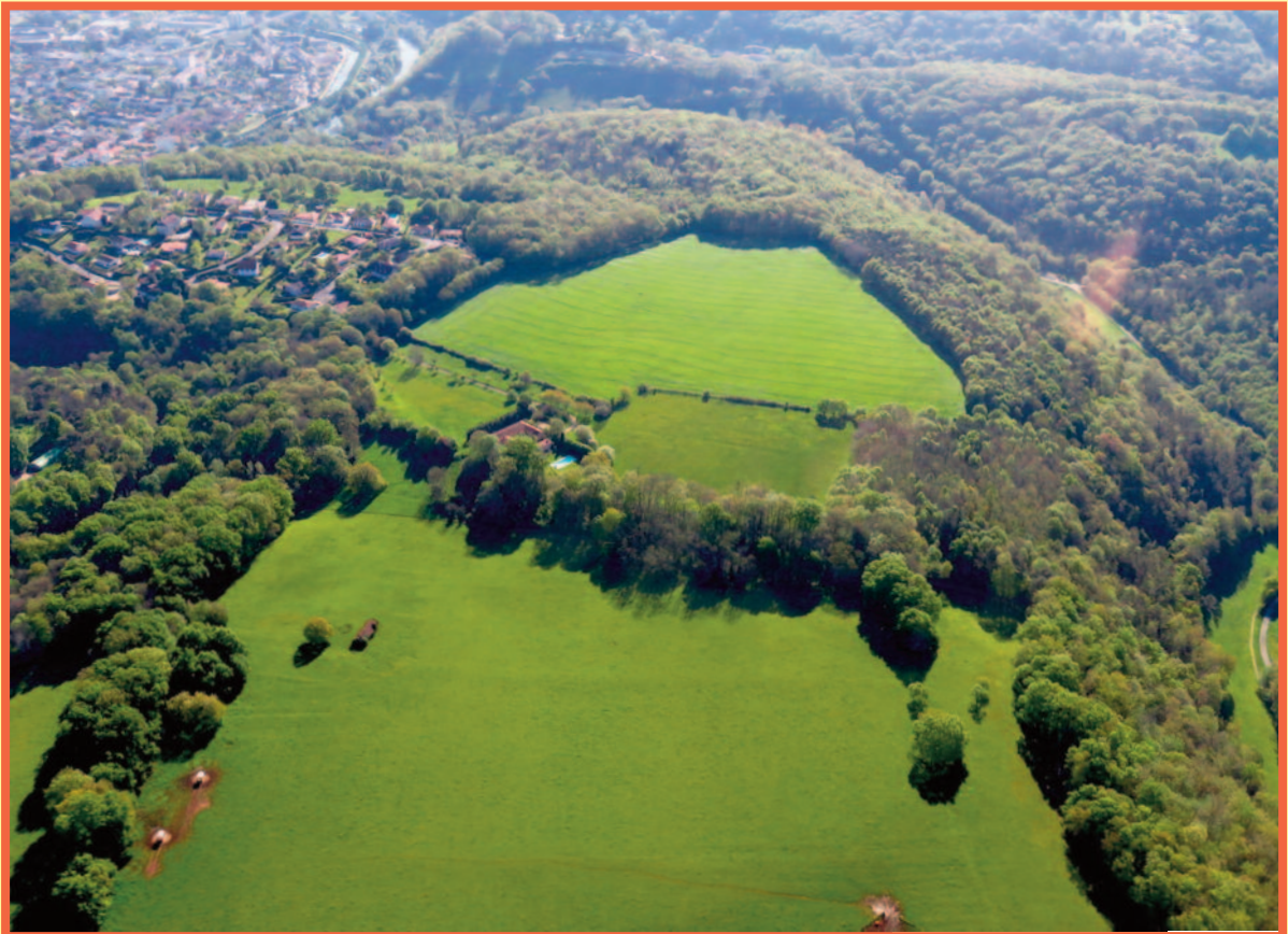
L'oppidum gaulois des Pétrrocors qui domine Périgueux.

Pensez à prendre de bonnes chaussures pour un circuit d'environ 3 km.