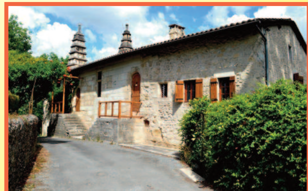
L'ancien hôpital de Charroux, appelé «La Maladrerie»